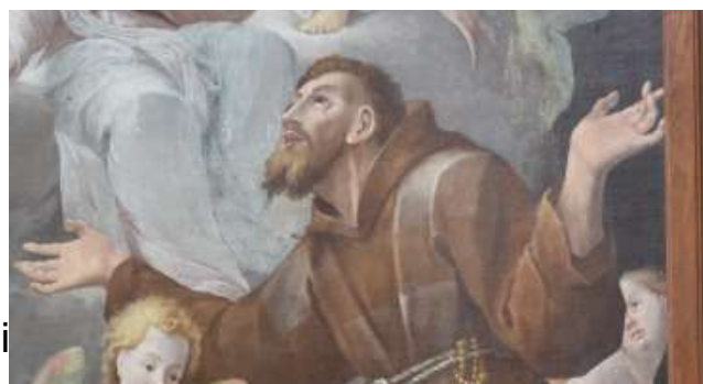
S. Francesco - chiesa Albogasio sup.

Il tema si lega alle celebrazioni per gli 800 anni dalla morte di San Francesco.