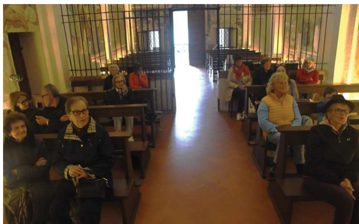
14 maggio: momenti pellegrinaggio Madonna dei Ghirli - Campione